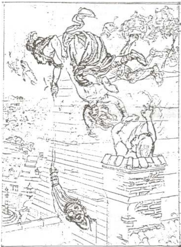
Vorzeichnung zur "Walburgisnacht" (1896/97) - Curiger, S.75)

Ich assoziiere zum rechtschaffenen Psychoanalytiker ein paar kollegiale Erinnerungen: Wie wir, damals als Vorarlberger Gruppe*, in unserer Diskussion über weibliche Sexualität auf die "Hexen" stießen und ein "Hexensymposium" vorschlugen, kamen aus den psychoanalytischen Arbeitskreisen mich überraschende, emotionale Äußerungen: